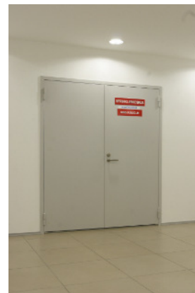
Lengi tüüp XS

Toote ostmisel on võimalik sõlmida korralise hoolduse lepingu.